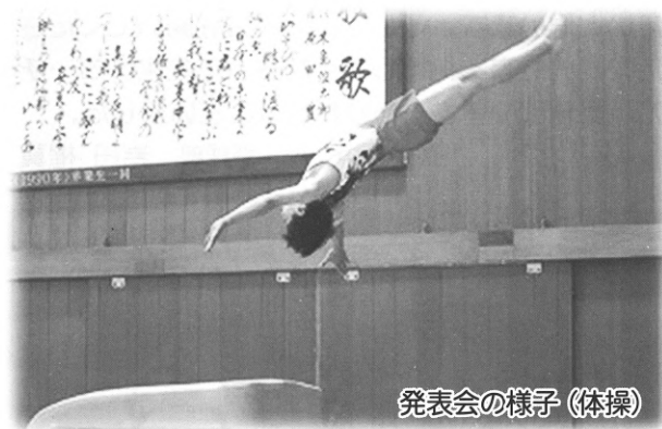
発表会の様子(体操)

* 体操部は7月26日に校内演技発表会をしました。今年は、市総体・県総体がなくなりましたが、部員のみんが全力で演技をすることができたと思います。この発表会に向けて演技を考え努力したことが、