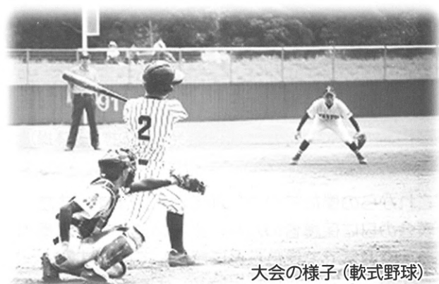
大会の様子(軟式野球)

* 新型コロナウイルスが流行し、バレーボールができない日々が続き、私たちはとてもショックを受けていました。ですが、代替大会が行われることを知り、部員全員が勝ちたいという気持ちで一つになりました。