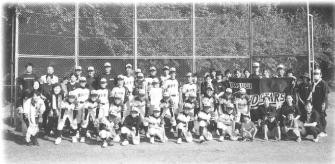
安来ゴールドスターズのみなさん