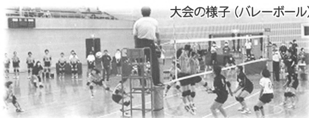
大会の様子(バレーボール)

* 新型コロナウイルスが流行し、バレーボールができない日々が続き、私たちはとてもショックを受けていました。ですが、代替大会が行われることを知り、部員全員が勝ちたいという気持ちで一つになりました。