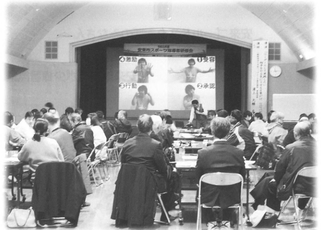
2020. 02. 16 安来市スポーツ指導者研修会 「ペップトーク」 わかさ会館