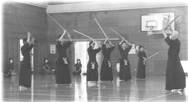
安来剣道スポ少練習風景