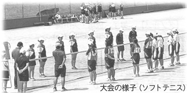
大会の様子(ソフトテニス)

この大会は、例年の大会と違い、勝っても負けても最後なので、どの選手も本当にソフトテニスを楽しんでプレーしました。中学校生活で一番楽しい試合だったと思いました。